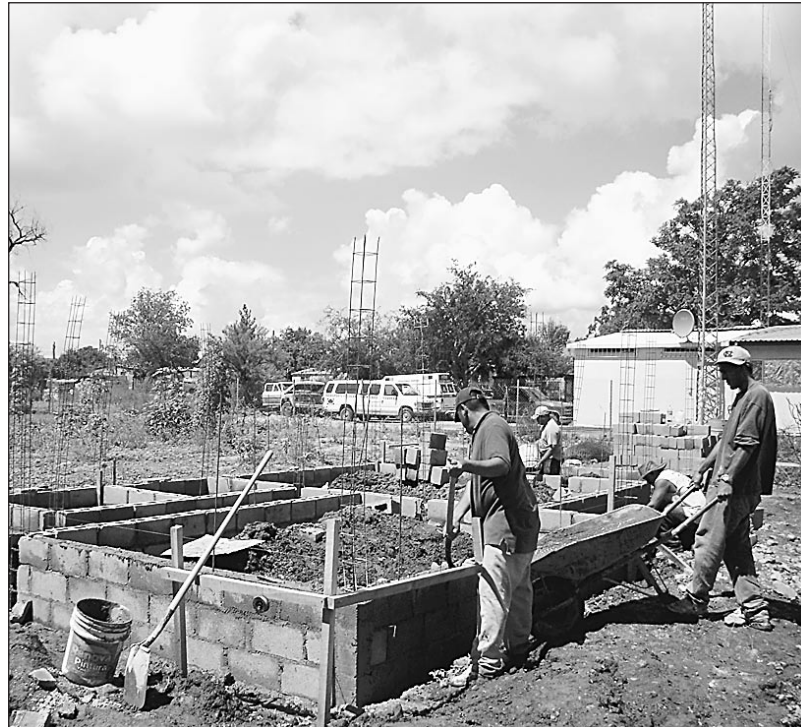
Aquí se construye, a un costado de la Comandancia Municipal de Fronteras, el restaurante rústico, que es uno de los proyectos de las "chicas bravas" para impulsar el turismo y economía del Municipio, sólo que las lluvias han detenido unos días el avance de la obra.